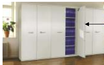
Safe-Co 60 i miljø