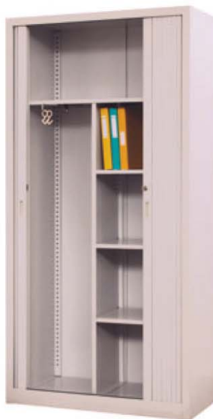
Art. nr: 70 337