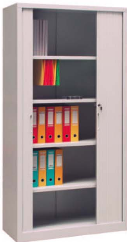
Art. nr: 70 274

Eksempel på standard innredninger i kontorskap.